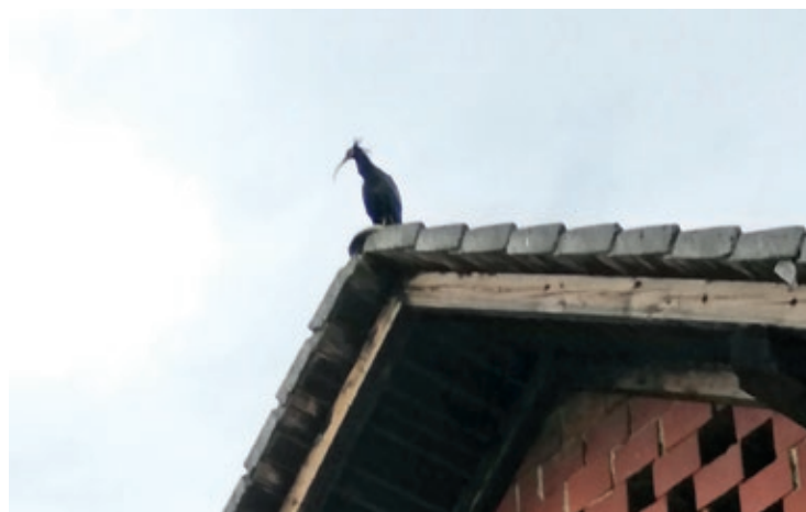
Klavžar na vrhu slemena gospodarskega poslopja na Igu, fotografiran 16. julija 2021

Večina prostoživečih klavžarjev (le okoli 400 osebkov) danes živi v Maroku, kjer jih najdemo v polpuščavah in stepah. Prehranjujejo se na skalnatih področjih, ki so v bližini reke ali potoka, njihova prehrana pa je raznovrstna - na meniju se znajdejo žuželke,