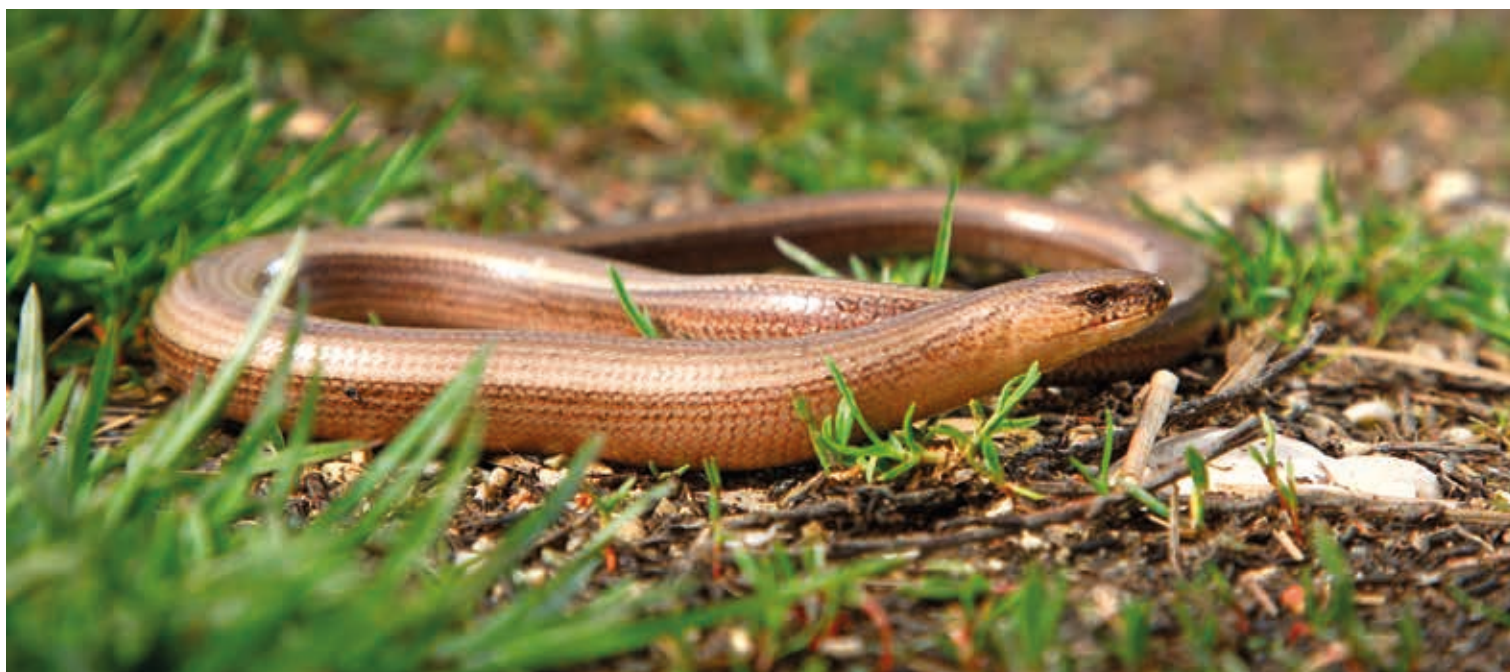
Slepec je videti kot kača, ampak je v resnici breznoži kuščar. Njegova najljubša hrana so polži, zato je dobrodošel prebivalec naših vrtov.