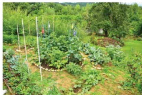
Ogratek Tanje Borovšak iz Suhega Vrha

Ogratek Majde Zrinski ima več prvin, ki ga loči od drugih. Poleg vzorno obdelanega zelenjavne-