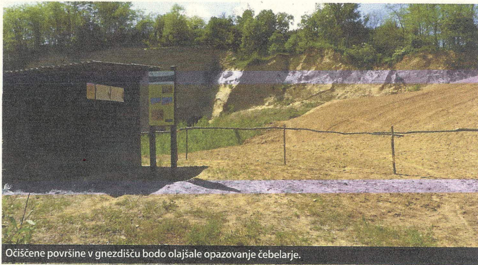
Očiščene površine v gnezdišču bodo olajšale opazovanje čebelarje.