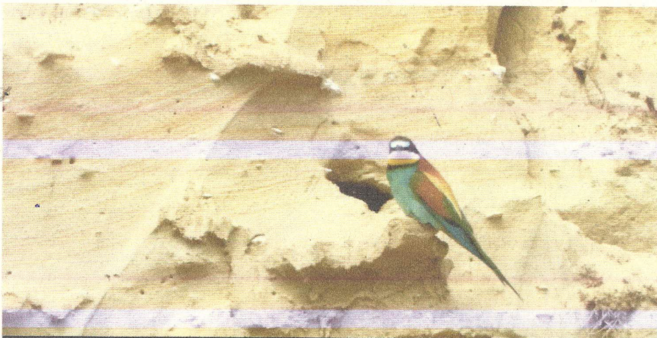
Čebelar se je ponovno vrnil na območje peskokopa Župjek na Bizeljskem.