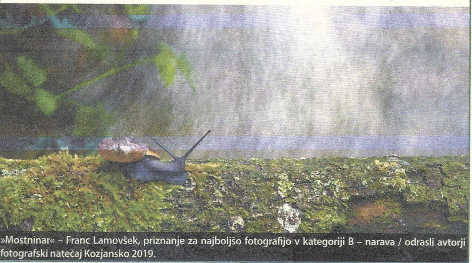
»Mostninar« – Franc Lamovšek, priznanje za najboljšo fotografijo v kategoriji B – narava / odrasli avtorji fotografski natečaj Kozjansko 2019.

Natečaj ima 2 starostni kategoriji: avtorji do 15 let in odrasli avtorji ter 5 različnih tematskih sklopov: A – krajina, B – narava, C – kultura, D – ljudje in E – kozjansko jabolko.