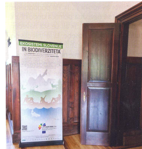
Razstava Ekosistemi Slovenije na gradu Podsreda.