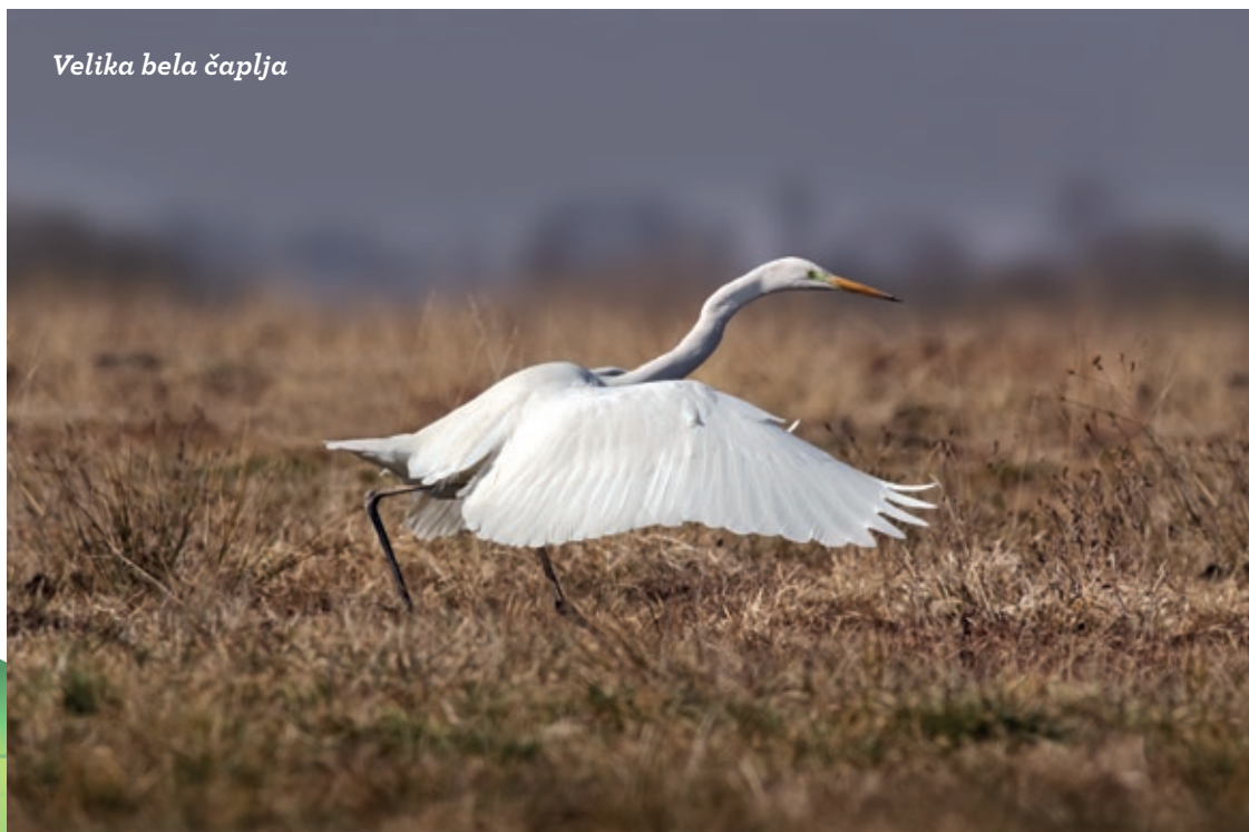
Velika bela čaplja