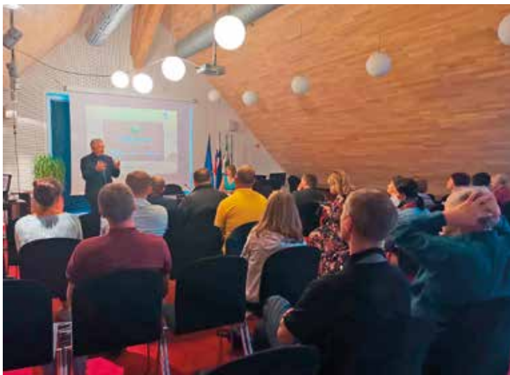
Prvi del srečanja v Centru Ig