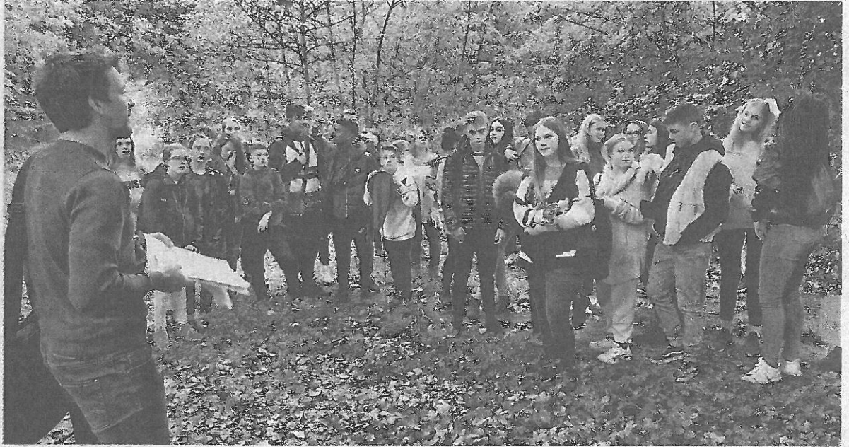
Spoznali so živalske in rastlinske vrste v gozdovih ob reki Muri. FOTOGRAFIJA ARHIV ŠOLE

Iskali ideje za izboljšanje razmer v gozdovih – Razkriški učenci bodo vrnili obisk