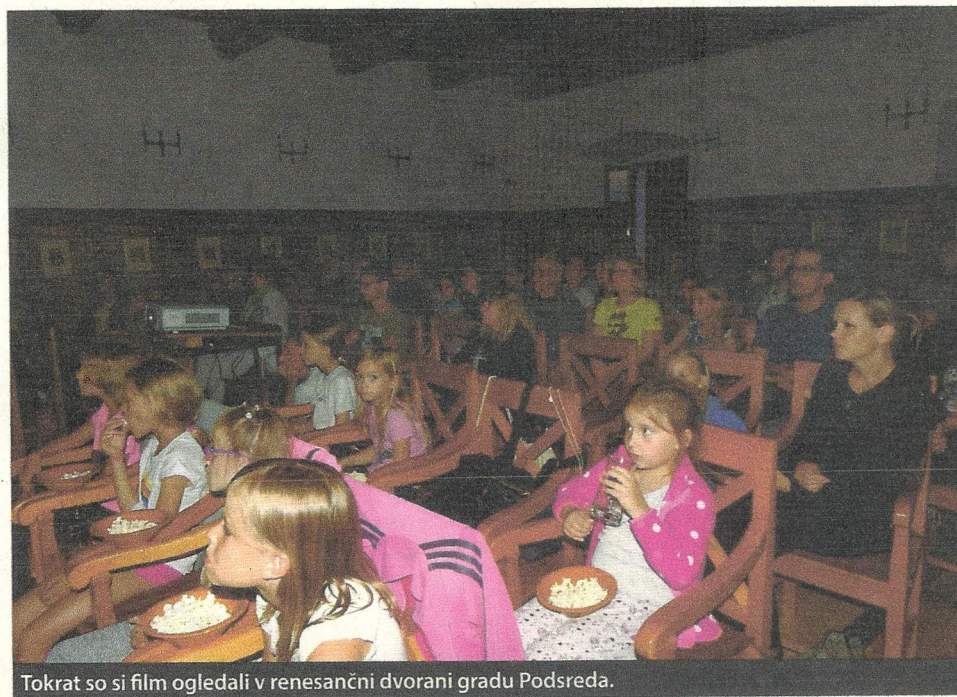
Tokrat so si film ogledali v renesančni dvorani gradu Podsreda.