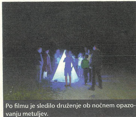
Po filmu je sledilo druženje ob nočnem opazovanju metuljev.