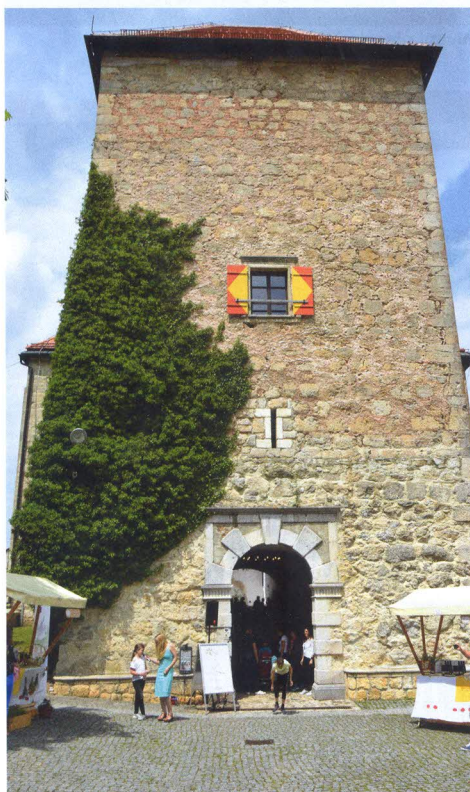
Pod mogočnim grajskim stolpom pestra ponudba.