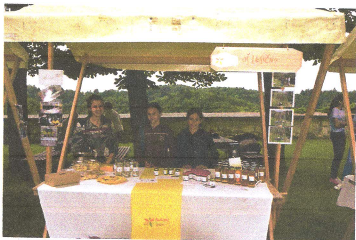
Predstavila se je tudi OŠ Lesično.