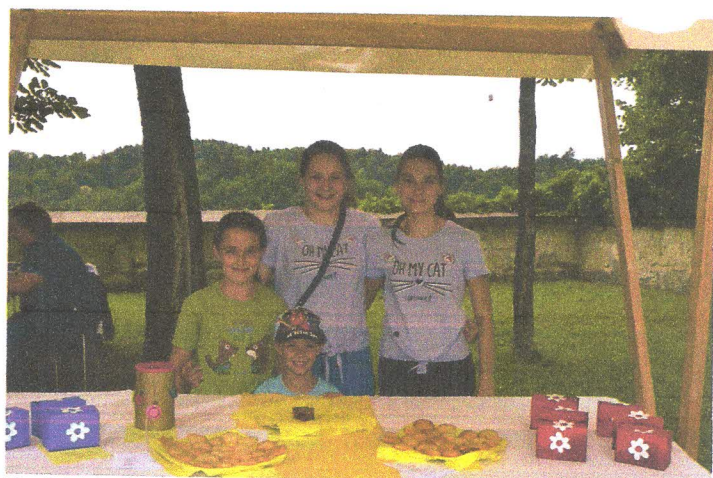
Na stojnici OŠ Koprivnica je bilo moč poskusiti slasne piškote.