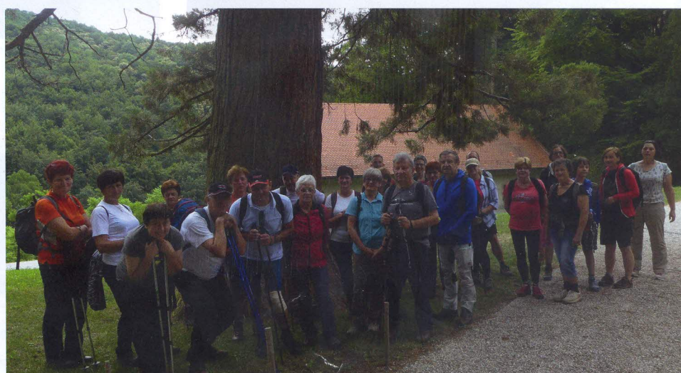
Že pred samim odprtjem festivala so se na pot podali pohodniki, ki so prehodili del Kozjanskega parka.