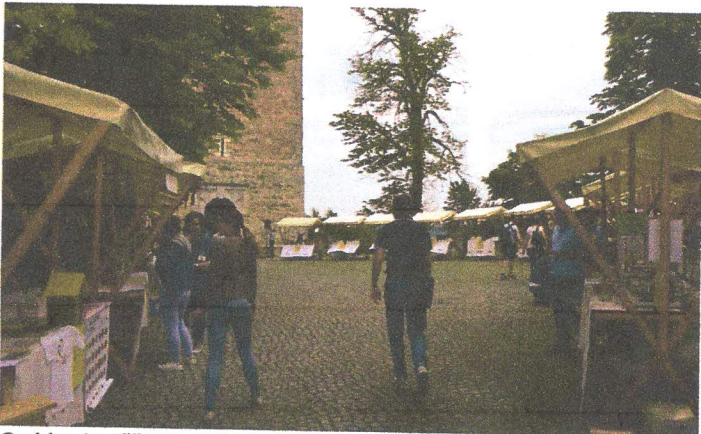
Grajsko dvorišče je nudilo zanimiv ambient razstavljavcem.