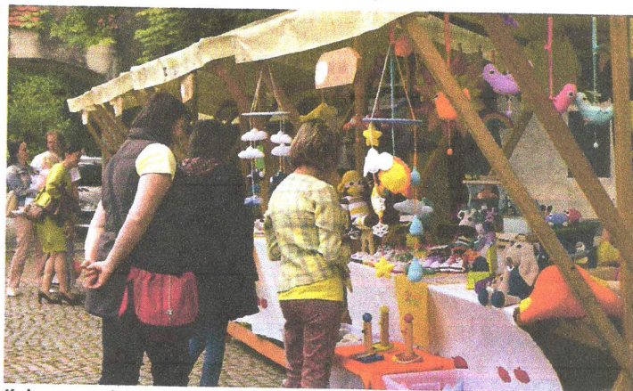
Kaj vse ponujajo stojnice?