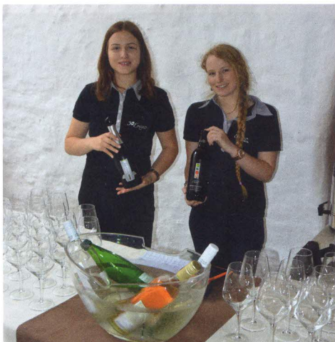
Vino in hrana, tokrat iz Hiše vin Emino.