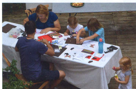
Ustvarjali so lahko vsi, tako najmlajši kot tudi odrasli.