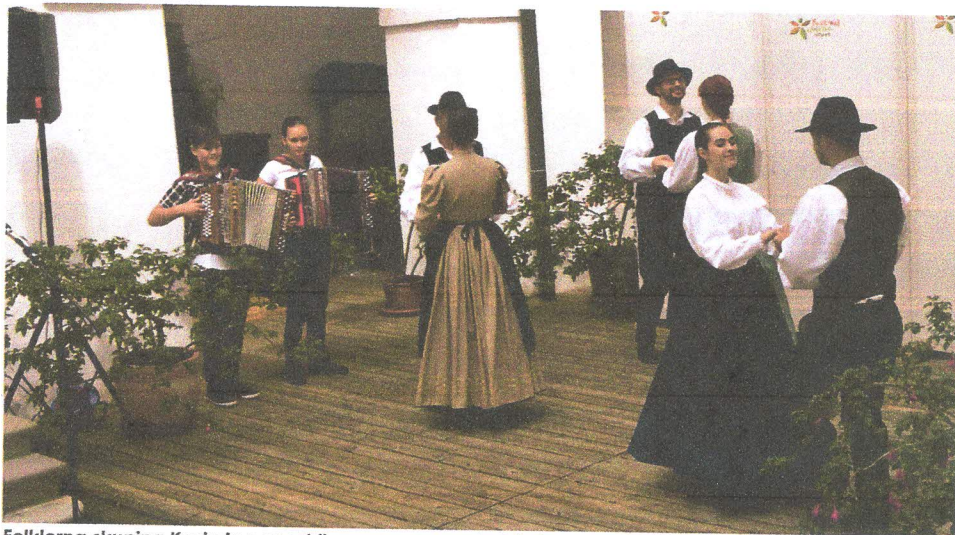
Folklorna skupina Kozje je popestrila program z zanimivimi plesnimi koraki in petjem.

Dušan Klenovšek iz Kozjanskega parka je predstavil svet žuželk in poslušalci so družno ugotovili, da je kozjanska krajina, kar se tiče vrst, izredno pestra, dr. Andreja Kavčič pa je predstavila Invazivne vrste. Poleg predavanj je bilo poskrbljeno tudi za glasbeni oddih, Etno skupina Nojek je namreč še enkrat dokazala, da so skupina odličnih glasbenikov. Festival ekološke hrane na gradu Podsreda je tako ponudil ogromno in ne dvomimo, da bo v prihodnje zrastle v še večji festival in postal paradni konj promocije ekološke pridelave in predelave. (Jernej Šulc)