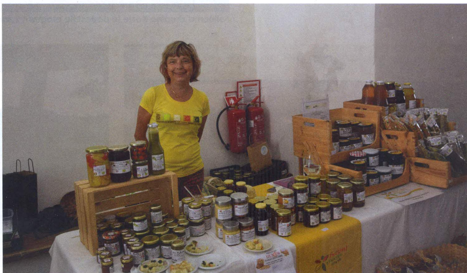
Namazi, testenine in še in še so ponujali na Ekološki kmetiji Šmalčič.