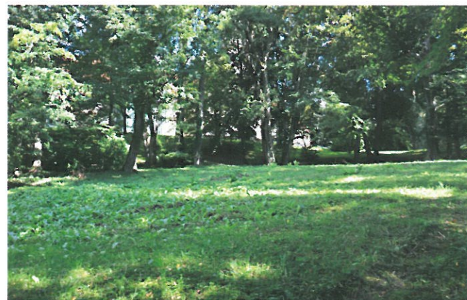
Grajski park

Projekt z akronimom Green Exercise je sofinanciran s sredstvi iz Programa čezmejnega sodelovanja Interreg V-A Slovenija-Madžarska. Rdeča nit projekta je vadba na prostem, zato že pripravljamo načrte in izbiramo igrala za Zeleni park v grajskem parku pred gradom Grad, ki bodo na voljo za uporabo v poletnih mesecih.