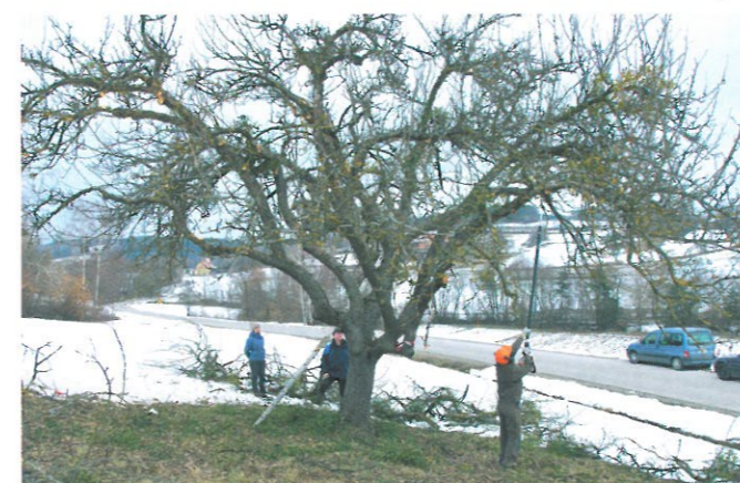
V letošnjem letu bomo obrezali več kot 900 sadnih dreves.