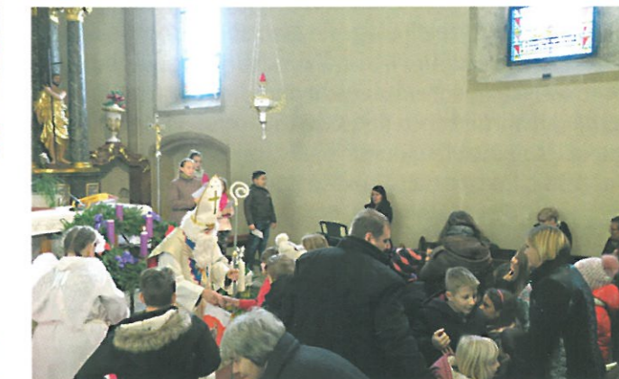
Sv. Miklavž prinesel veliko daril