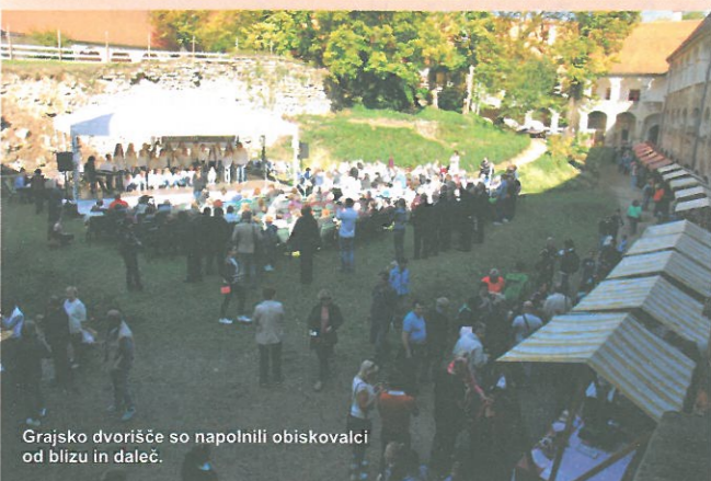
Grajsko dvorišče so napolnili obiskovalci od blizu in daleč.