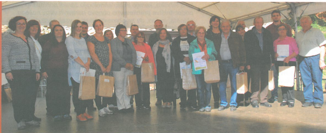
Prejemniki nagrad in priznanj akcij 4xNAJ in naziva Skrbnik narave v Krajinskem parku Goričko 2017 na Grajskem bazarju.

Na podlagi spremljanja in vsakoletnega štetja ptic ocenjujemo, da na Goričkem živi 20-40 parov smrdokaver. Za smrdokavo je zelo pomembno, da ji ohranimo naravna gnezdišča, kamor se vsako leto znova vrača. Zaposleni v JZ KPG smo zato opravili odstranitev bele omele z jablan, kjer upkaši gnezdi že več let. Veliki skovik, edina prava selivka med našimi sovami, je gnezdila v 21 gnezdilnicah. Mladiči so uspešno poleteli le iz 15-tih. V vseh gnezdilnicah so bili najmanj 3 mladiči. Pri preverjanju gnezd sta bili najdeni dve samici, obročkani leta 2015, ki sta pred dvema letoma gnezdili v bližini. Obema vrstama boste zelo pomagali s sajenjem dreves starih sort ter ohranjanjem mejic in travnikov. V gnezdilnicah so bili najdeni še škorci, poljski vrbaci, sinice, pogorelčki in brglezi.