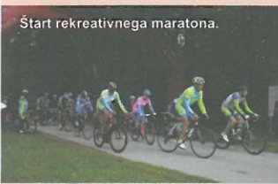
Start rekreativnega maratona.