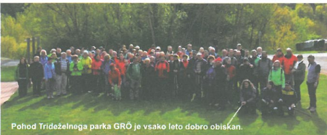
Pohod Trideželnega parka GRÖ je vsako leto dobro obiskan.

V okviru čezmejnih projektnih aktivnosti, rekreativnih prireditev in sodelovanja s šolami veliko pozornosti namenamo druženju v naravi. Aprila smo ob svetovnem dnevu Zemlje organizirali pohod Trideželnega parka Goričko-Raab-Őrség, kjer so pohodniki spoznavali raznolikost krajine ob avstrijsko-madžarski meji. Konec maja smo v sodelovanju s KUD Budinci pripravili družabne igre. Sedem ekip iz NP Őrség in KP Goričko se je pomerilo v domiselnih spretnostnih izzivih. V začetku septembra so ljubitelji kolesarjenja odkrivali razgibano kulturno krajino Goričkega in Madžarske na rekreativnem maratonu. Na skupnih prireditvah ob stičišču treh dežel se povezujemo in medsebojno bogatimo z izkušnjami in znanjem. Učenci višjih razredov goriških šol so se pomerili v Kvizu o naravi in človeku. Mlajši učenci so ustvarjali v mednarodnem natečaju in obiskali Muzej na prostem Pityerszer v Narodnem parku Őrség na Madžarskem.