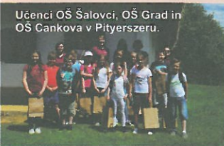
Učenci OŠ Šalovci, OŠ Grad in OŠ Cankova v Pityerszeru.