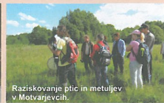
Raziskovanje ptic in metuljev v Motvarjevcih.