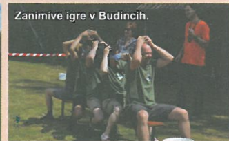
Zanimive igre v Budincih.