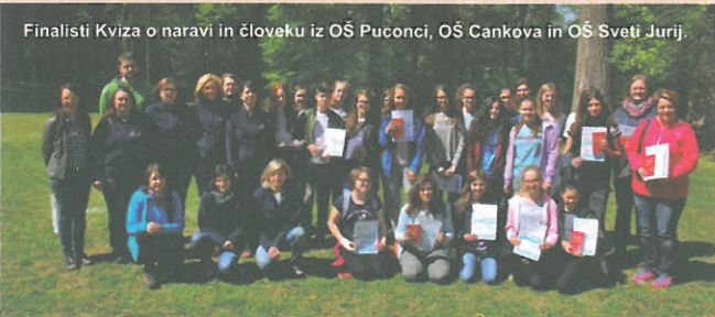
Finalisti Kviza o naravi in človeku iz OŠ Puconci, OŠ Cankova in OŠ Sveti Jurij.